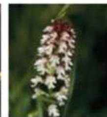
Kukavičevke ali orhideje ( Orchidaceae )