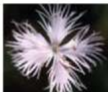
Klinček ( Dianthus sternbergii )