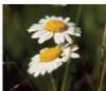
Ivanjščica ( Leucanthemum )