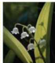
Šmarnica ( Convallaria majalis )