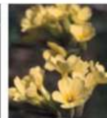
Visoki jeglič ( Primula elatior )