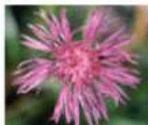
Glavinec ( Centaurea sp. )