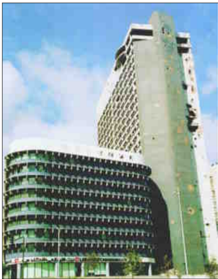
Sledovi izstrelkov na pročelju bejrutskega Holiday Inna – Luknje, ki so nastale med državljansko vojno, so pustili v opomin prihodnjim rodovom.

Kljub vsemu ne gre zanikati, da je Libanon država, ki je uradno še vedno v vojni z Izraelom. Izraelska letala ga občasno nisko preletavajo, kot da bi hotela opozoriti, kdo ima premoč. To pa je, poleg sledov izstrelkov na nekaterih procejih in spomenikov padlim, vse, kar spominja na vojno. Bližnjevzhodni Monte Carlo, še eden od laskavih vzhodov Libanona, se pospešno razvija tudi zaradi nizkih davkov. Denar kroži z vratlomono hitro in v dih nekaj tisoč dolarjev več stane tovrstna registrska tablica. Na ce-